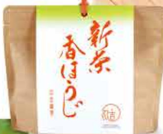
■新茶香ほうじ 1袋 756円(税込)