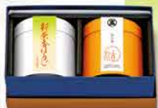
■焙じ茶二品 化粧箱詰合せ ■新茶香ほうじ ■五番焙じ茶 2,322円(税込)