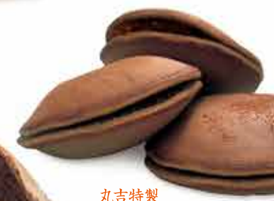
丸吉特製 ■焙じ茶最中 1個 162円(税込)