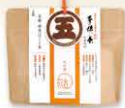
⑤名物 頓宮ほうじ茶 540円(税込)