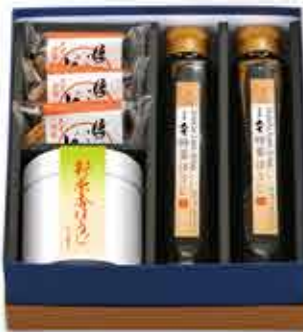
■焙じ茶と糖蜜ほうじとお菓子 化粧箱詰合せ ■新茶香ほうじ ■糖蜜ほうじ2 ■焙じ茶どら焼3 4,590円(税込)